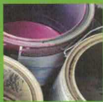
PINTURA Y SOLVENTES