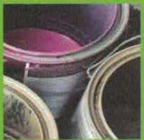
PAINT & SOLVENTS