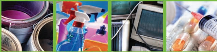
PAINT & SOLVENTS